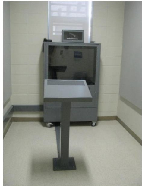
Afbeelding 3: Ruimte in een detentiecentrum in Québec voor de videoverschijning van de verdachte ter terechtzitting. Deze ruimte staat in verbinding met de rechtszaal.

Tijdens de zitting kan de advocaat de rechter verzoeken 481 om de zitting te schorsen voor een video-gesprek in de visioparloir tussen verdachte en advocaat. 482 Als de rechter instemt, moeten de advocaat en de verdachte beiden verhuizen naar de visioparloirs . Verder kan de advocaat ook buiten de zitting om via een online reserveringssysteem visioparloirs reserveren voor overleg met zijn cliënt: een in het detentiecentrum voor de cliënt en een visioparloir in de rechtbank van Quebec voor zichzelf. 483 Advocaten kunnen ook een videoconferentiesysteem op hun kantoor kunnen installeren, waarmee zij, nadat ze dit via het reserveringssysteem hebben aangevraagd, direct verbinding kunnen maken met een visioparloir in een detentiecentrum. 484