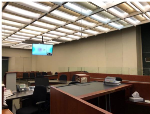
Afbeelding 1: Één van de rechtszalen van de rechtbank van

Alle videobezoekkamers (zowel die in de gerechtsgebouwen als die in de