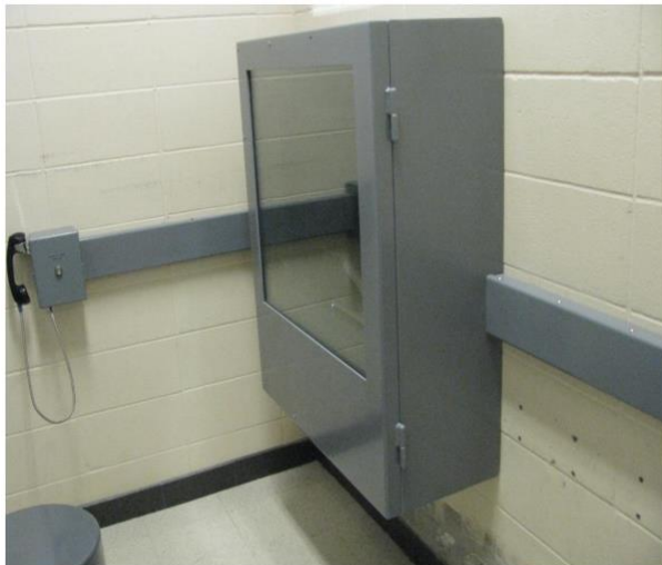
Afbeelding 4: Visioparloir in een detentiecentrum in Québec. Deze staat in verbinding met de visioparloir voor de advocaat in de rechtbank.

Naast investeringen in apparatuur, is er ook aandacht geweest voor training van het personeel om de apparatuur te bedienen maar ook over de gang van zaken tijdens het verhoor via videoconferentie. Bijvoorbeeld hoe de verdachte tijdens de zitting naar de visioparloir kan worden begeleid indien er